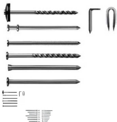
Pregos e Grampos